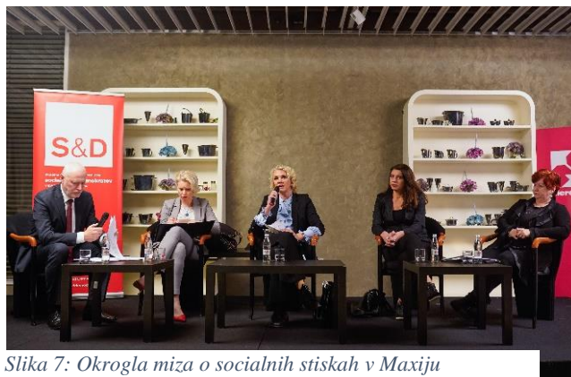
Slika 7: Okrogla miza o socialnih stiskah v Maxiju