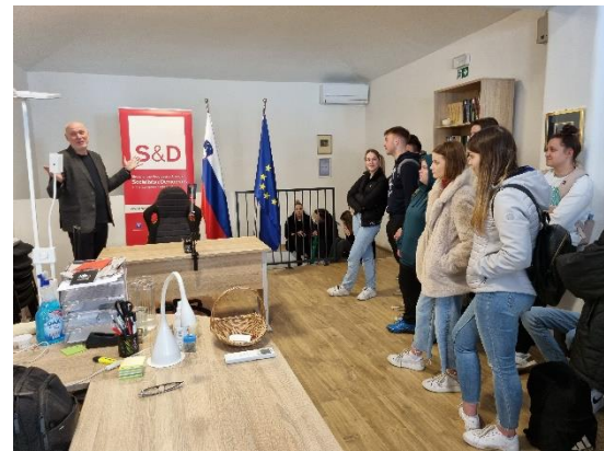
Slika 6: Obisk Ekonomske šole in gimnazije Celje v poslanski pisarni v Ljubljani