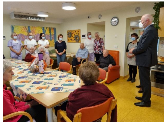
Slika 4: Obisk tolminske enote Doma starejših Podbrdo