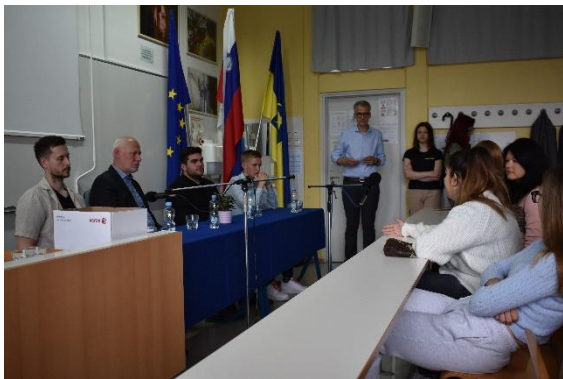
Slika 3: Okrogla miza o medvrstniškem nasilju na Ekonomski šoli Celje