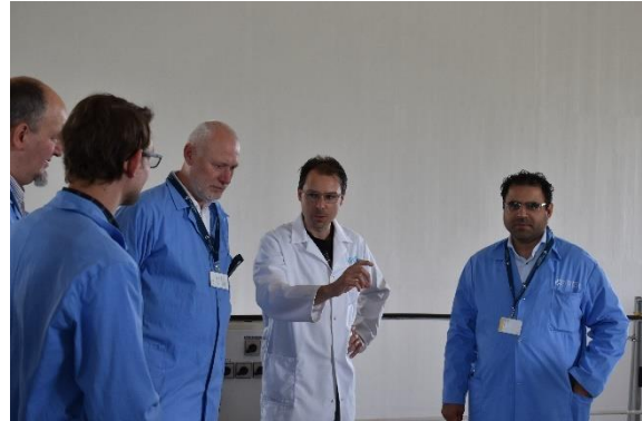
Slika 2: Obisk evropskega poslanca dr. Mohammeda Chahima v jedrskem reaktorju v Podgorici (Ljubljana)