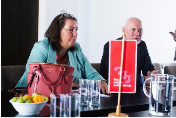
Slika 1: Obisk evropske poslanke Agnes Jongerius pri ZSSS