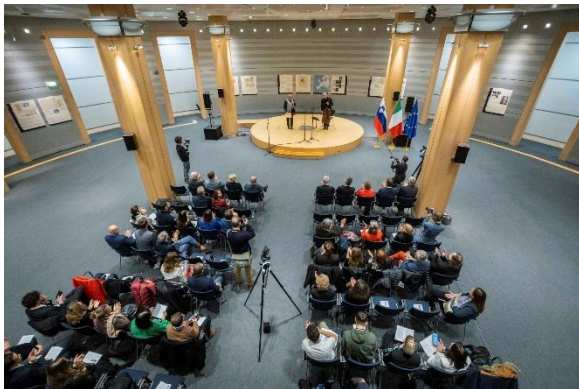
Slika 5: Otvoritev razstave o Mastru narodov – Giuseppeju Tartiniju v Evropskem parlamentu